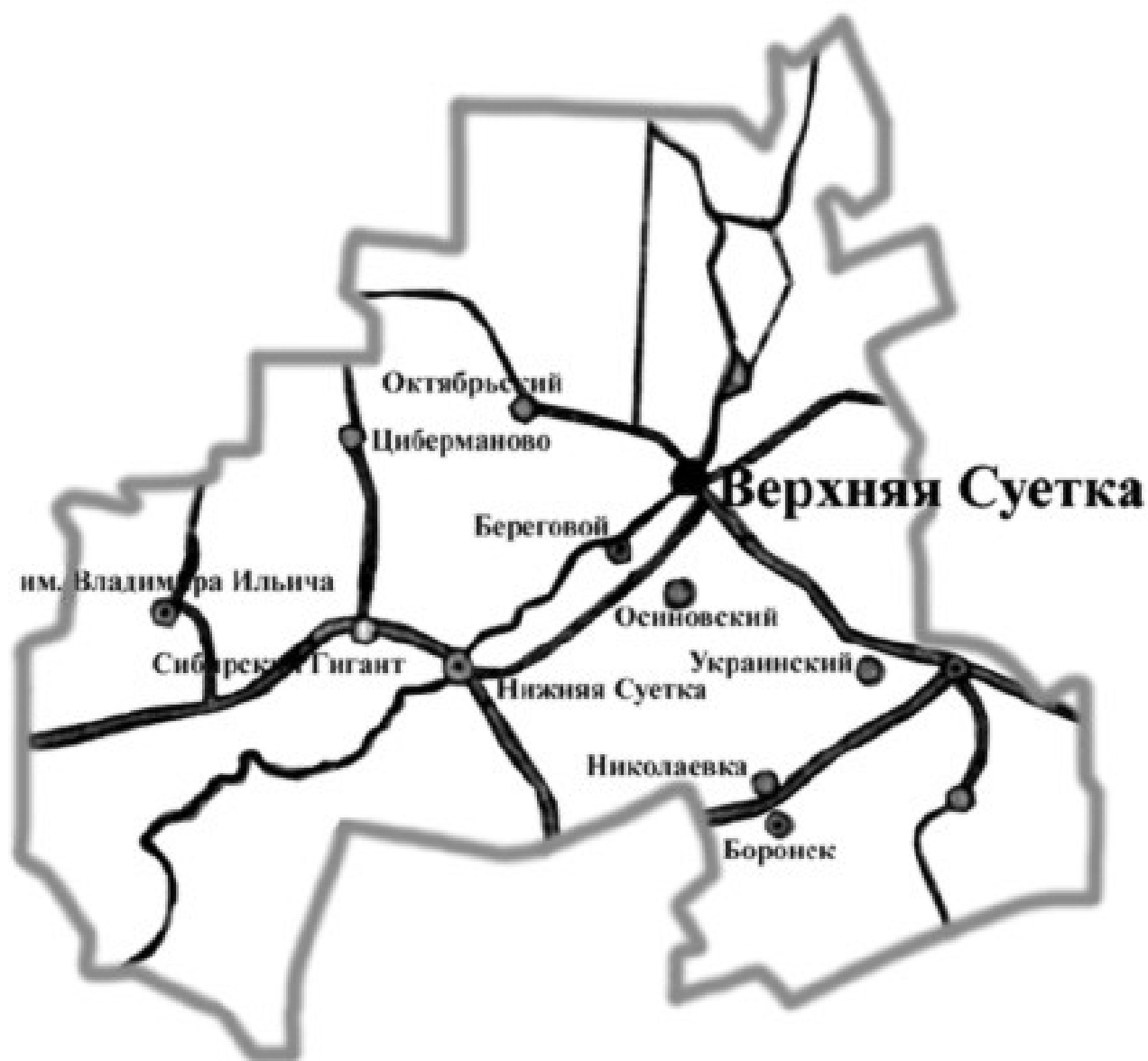
Рис. 2. Карта-схема МО Суетский район Алтайского края.

Село Верх-Суетка является центром муниципального округа. В центре муниципального округа сосредоточены основные градообразующие предприятия и объекты культурно-бытового обслуживания. Административный центр МО Суетский район Алтайского края расположен в 320 км от города Барнаула. До города Славгород – 115 км, до ближайшей железнодорожной станции Новоблаговещенка – 72 км. Связь между населенными пунктами МО Суетский район Алтайского края осуществляется по автомобильным дорогам, которые имеют как асфальтовое покрытие так и щебеночную отсыпку, грунтовыми дорогам.